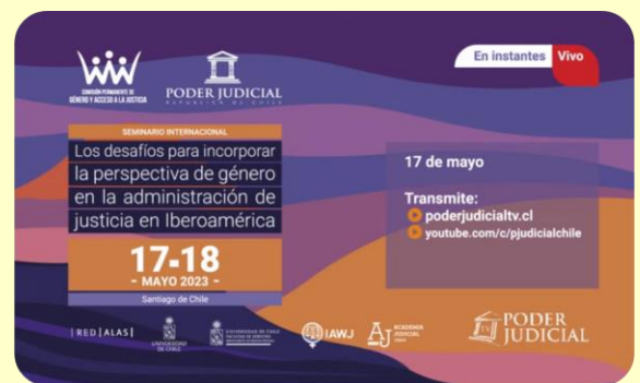
Seminario "Desafíos para incorporar la perspectiva de género en la administración de justicia"