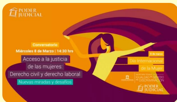
Seminario "Acceso a la justicia de las mujeres: derecho civil y laboral. Nuevas miradas y desafíos"